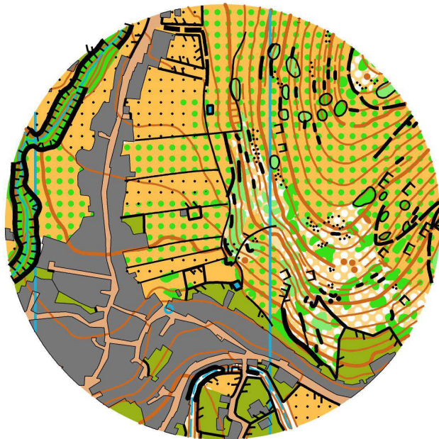
Ejemplo de mapa

Para la carrera se utilizará escala 1:7500