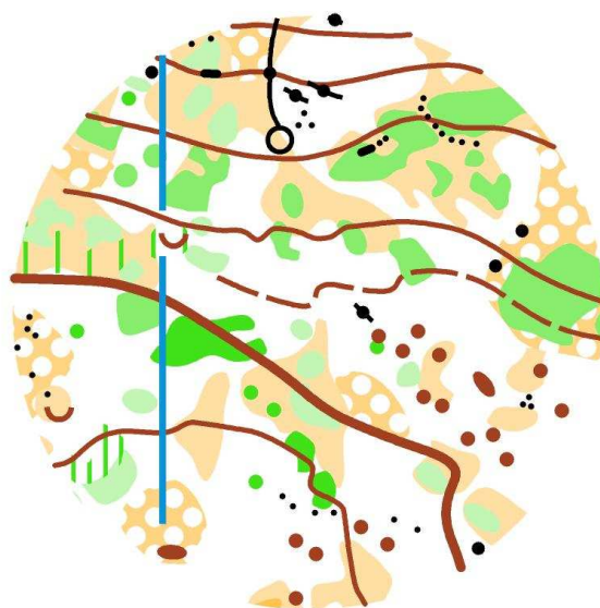
Ejemplo de terreno

Bosque de pinos con zonas de vegetación espesa y arbustos, y numerosos detalles de relieve, rocas y muros. Desniveles suaves a moderados. El terreno es pedregoso por lo que se recomienda protección en los tobillos.