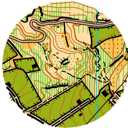
Ejemplo de mapa

ATENCIÓN: está totalmente prohibido saltar vallas marcadas como impasables o entrar en fincas privadas. Gran parte de la vegetación baja (verde rallado) se trata de aulaga, por lo que evitarla será fundamental en algún tramo y puede condicionar alguna elección de ruta.